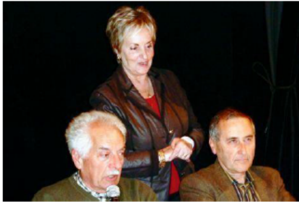
Quelques sages parmi les 38 du conseil.

Dans le cadre de la démocratie participative, la ville de Floirac a souhaité la création d'un conseil des sages.