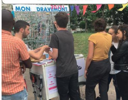
LA CARTE TISSÉE