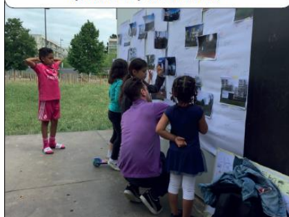
«J'AIME / J'AIME PAS»