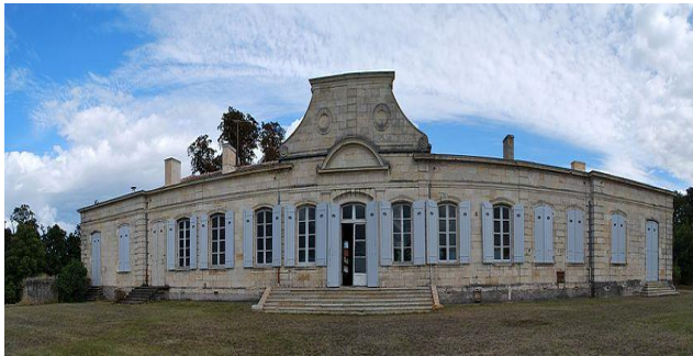
Domaine de Sybirol