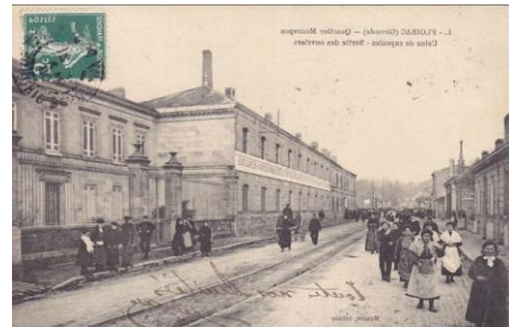
Exposition ferroviaire de Floirac Bets et Blanchard vers 1910