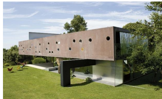
Maison à Bordeaux, conçue par Rem Koolhaas