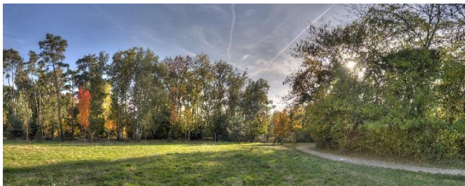
Domaine de la Burthe